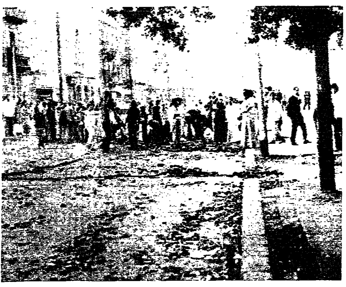
قبل عودة الهدوء ... منظرون يسدون شارعاً في القاهرة يوم الخميس الماضي

مليار و ٥٥٠ مليوناً ليرة ، تكاليف إعادة بناء وترميم ونهج المؤسسات الرسمية ، تمتلك المملكة العربية السعودية بنوياً . وقد أبلغ قرار الحكومة السعودية إلى الرئيس ياسر عرفات وذلك تكديداً لالتزام المملكة بمقرات مؤتمر القمة في الرياض والقاهرة ، وإعادة تصير لبنان ، وتقديم الاحتياجات المطلوبة لإزالة آثار الحرب . أما بالنسبة لتكاليف إعادة بناء القطاع الخاص البالغة خمسمائة مليار و ٨٠٠ مليوناً ليرة ، وغیر المباشرة بين ٢٠ و ٤٠ ملياراً حسب التقديرات الرسمية الأولية ، فستتم تمويلها بواسطة قروض يقدمها الصندوق العربي للإنماء والصندوق الكويتي للتنمية ، وتكون هذه القروض بكفالة الدولة ، علماً بأن الخسائر الإجمالية في لبنان ، حسب التقديرات هي نسي حدود ٢٢ مليار ليرة . زوار القصر الجمهوري من النواب أكدوا أمس بان الدول العربية ودية بالتزاماتها تجاه لبنان ، لإعادة بناء مؤسساته ومرافقه وإقتصاده ، وتأمين عودته إلى الحياة الطبيعية ، بنفس الالتزامات التي وفرت الضمانات الأمنية لترسيخ مسيرة السلام . ويؤكد الزوار من جهة ثانية إن قرارات جميع الأسلحة الثقيلة وأسلحة صريحة ، لا تيسر فيها ولا إبهام ، وقد اتخذ القرار بالاتفاق مع مختلف الأطراف الذين أبقوا أيضاً بتسليم مدهمة الأماكن التي يشتهر بان الأسلحة مخبأة في داخلها ، وستتم - البقية على الصفحة ٥ -